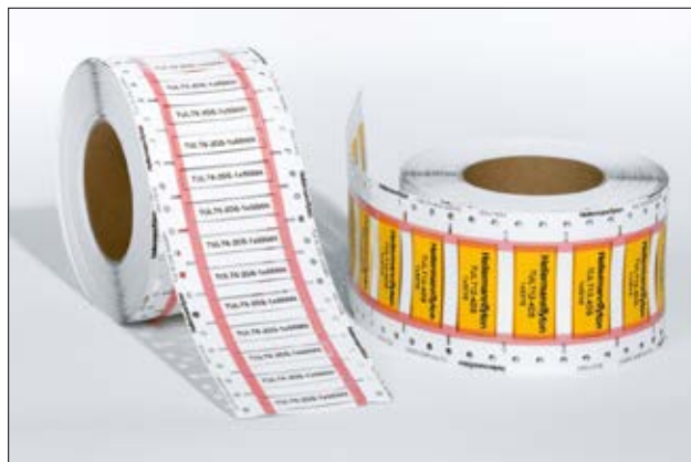
TULT DS mit gelben und weißen Schrumpfschlauchabschnitten.