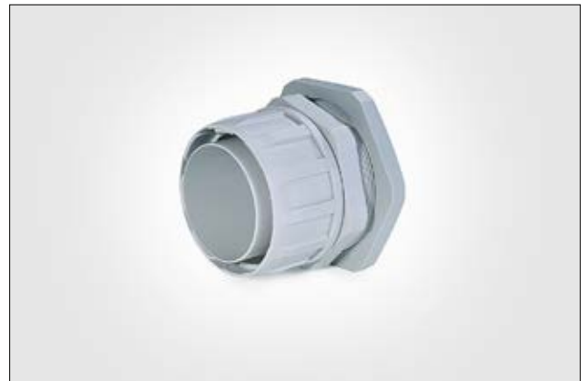
FG-M Verschraubung mit metrischem Gewinde.