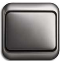
Platin (-20) mit Rahmen nea (-20)

Durch Details wie eine sanfte gerundete oder markante Formgebung und die vielseitige Farbpalette wirkt das Programm alpha unaufdringlich und dennoch einprägsam. Ein Schalter, der sich nahezu jedem Einrichtungskonzept anpasst.