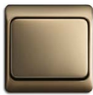
Bronze (-21) mit Rahmen exclusiv (-21K)