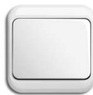
alabaster/studioweiß (- 24G) mit Rahmen nea (-24G)