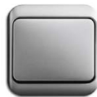
Titan (-266) mit Rahmen nea (-266)