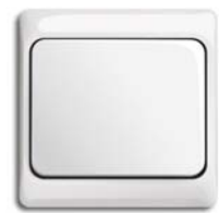
studioweiß matt (-24) mit Rahmen Exclusiv (-24K)