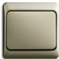
Palladium (-260) mit Rahmen (-260K)