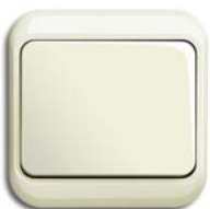
elfenbein/weiß (-22G) mit Rahmen nea (-22G)