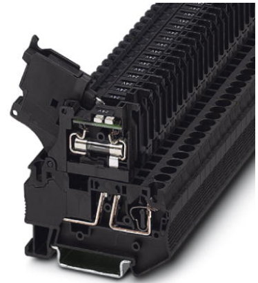
Abbildung zeigt die Variante ST 4-HESILED 24

http://eshop.phoenixcontact.de/phoenix/treeViewClick.do?UID=3036563