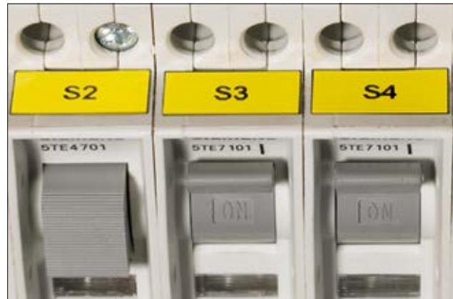
Helatag Laseretiketten ermöglichen die einfache und schnelle Kennzeichnung von Schaltschränken.