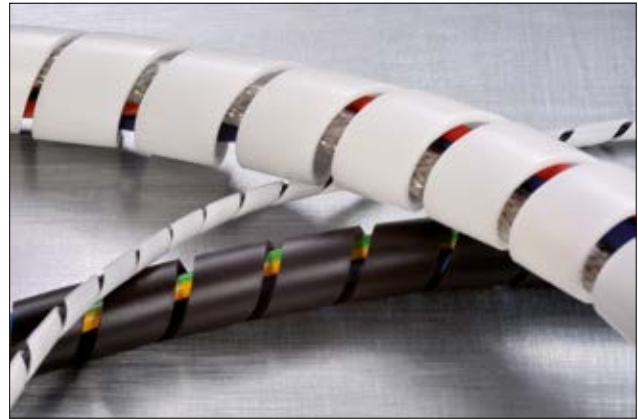
Spiralschlauch SBPEFR ist in mehreren Größen in Schwarz und Weiß erhältlich.