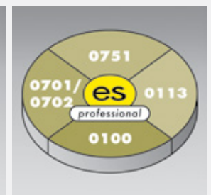
es control professional Komplett