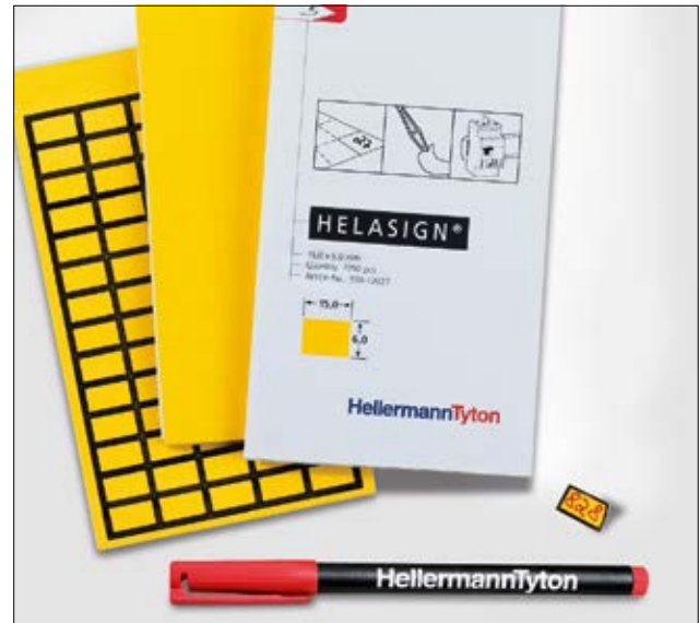
HELASIGN Gewebetiketten – robust und aufmerksamkeitsstark.