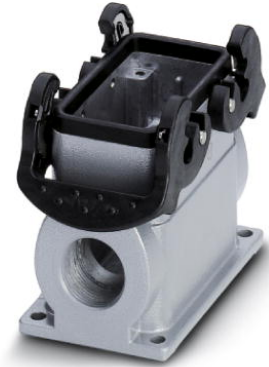
Abbildung zeigt Produktvariante mit der Höhe 74 mm.

http://eshop.phoenixcontact.de/phoenix/treeViewClick.do?UID=1604754