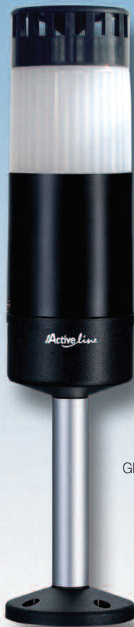
GH1 mit Schallgeber