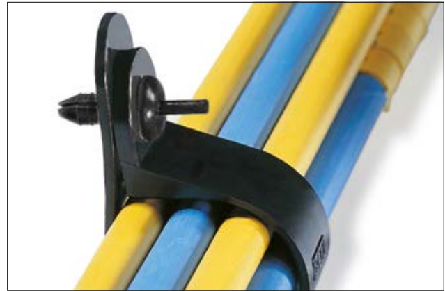
Spreizniete TY8P1 in der Anwendung.