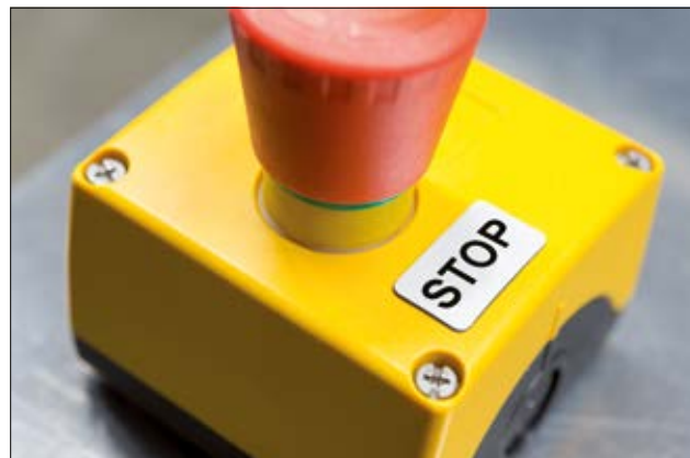
Idealer Ersatz für gravierte Schilder: Panel-Etiketten.