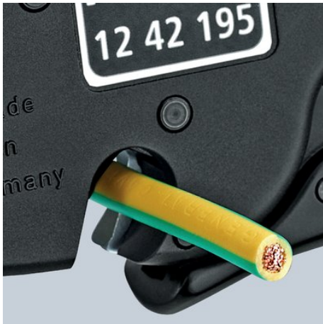
Drahtschneider bis 10 mm 2 mehrdrähtig

Klemmbacken aus Stahl verhindern ein Durchrutschen des Leiters