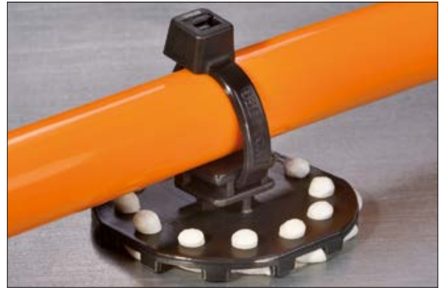
PMB5 mit Pastenkleber.