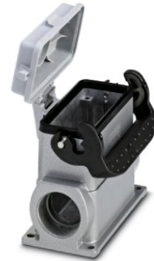
Foto zeigt Produkt ohne Verschraubung

http://eshop.phoenixcontact.de/phoenix/treeViewClick.do?UID=1771189