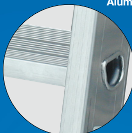
Neuartige, profilierte 80 mm tiefe Alu-Stufen fest verbördelt mit den Steigholmen