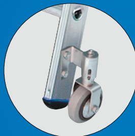
4 selbstarretierende 80 mm große Bockrollen